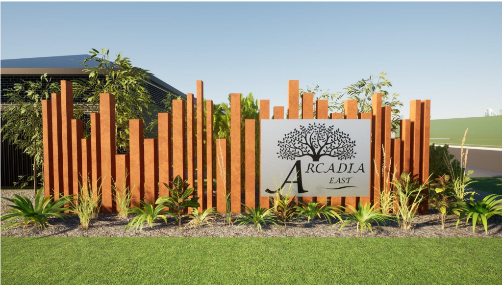
ARTIST IMPRESSION NOT TO SCALE